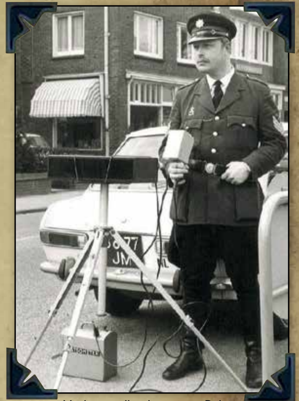
Venlo - snelheidsmeting - Politie