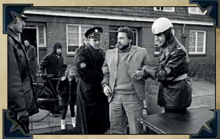
Demonstratie voor betere huisvesting in Venlo jaren 70.