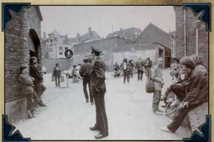
Toezicht cafe's in Venlo