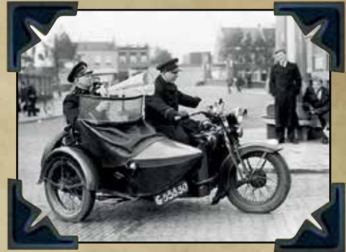
Hier spreekt de Politie....