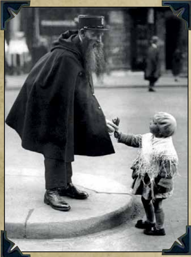
Porte Saint-Denis in Paris, circa 1920