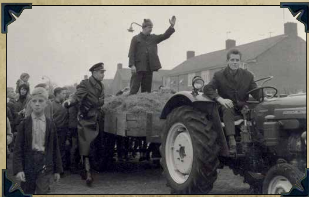
Begeleiding bij de opening drogisterij Smoorenberg in 1963 door Swiebertje...