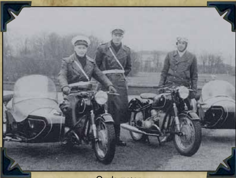
Op de motor