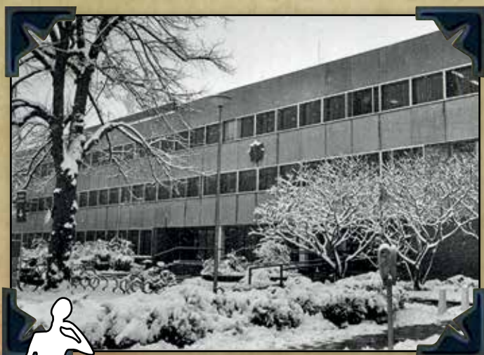
GP Bureau Marienburg Nmg