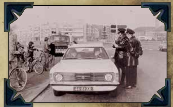
Venlo , november 1973. Autoloze Zondag