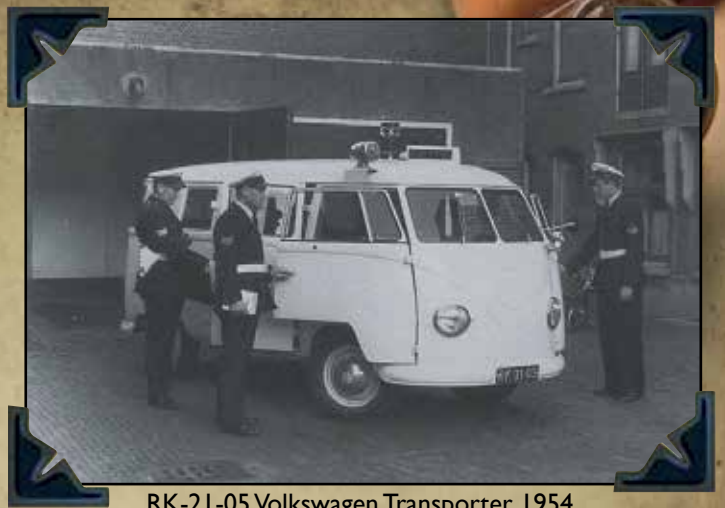
RK-21-05 Volkswagen Transporter 1954