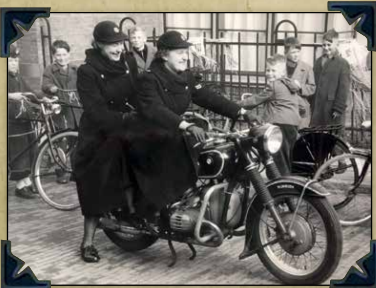
Twee agentes in Nijmegen.